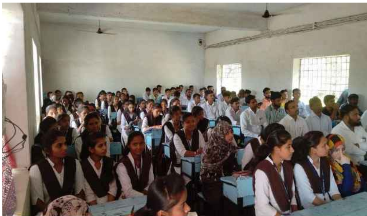
students in the workshop